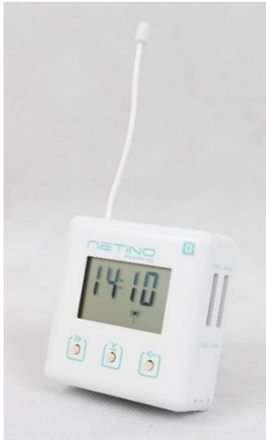
Rys. 1. Baza NXBD-01-ECO