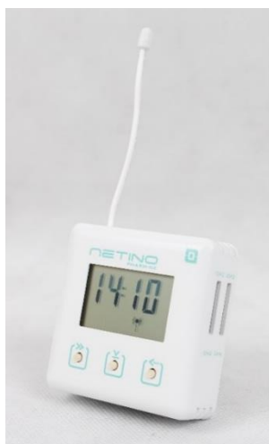
Rys. 1. Baza NXBD-01-HD