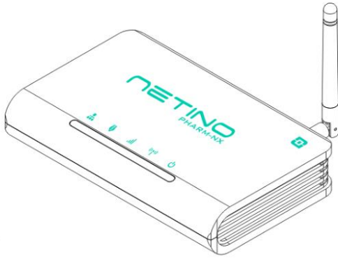
Rys. 1. Centrala NXR-02-HD-GSM